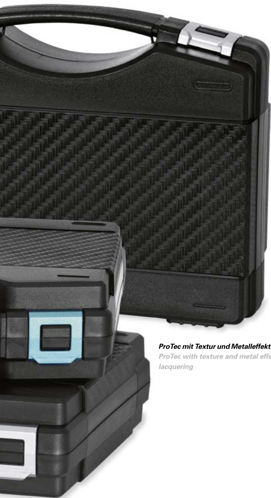
ProTec mit Textur und Metalleffektlackierung ProTec with texture and metal effect lacquering

Der Kunde steht für den Verpackungsspezialisten im Mittelpunkt. Oberstes Ziel für das lernende Unternehmen ist es, sich für die Erreichung hoher Kundenzufriedenheit kontinuierlich zu verbessern. Mit der insgesamt sehr positiven Bewertung haben die Kunden das gute Image der rose plastic AG bestätigt und das Unternehmen damit in seinem Weg und seiner Philosophie bestärkt.