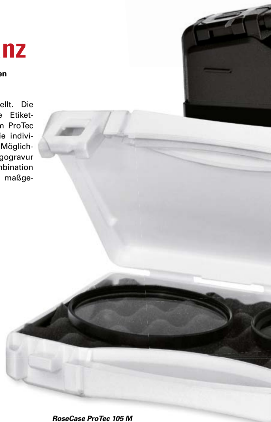
RoseCase ProTec 105 M

RoseCase ProTec 105 M The youngster in the ProTec family. Its compact and striking design is perfect for sales-promotion. Outer dimensions (width x height x depth): 187 x 143 x 42 mm (7.4" x 5.6" x 1.6").