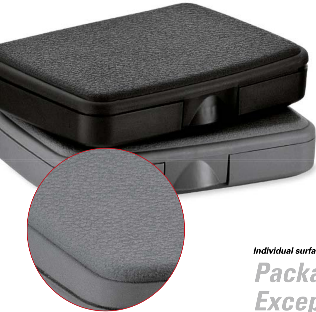
ConsumerBox mit Oberflächenveredelung in Lederoptik

wie die ConsumerBox oder die beiden RoseCase Kunststoffkofferserien ErgoLine und ProTec. Für die Veredelung mit Metalleffektlacken eignen sich in erster Linie Kleinteile. Durch kontinuierliches Umwälzen der Kunststoffteile wird die Lackschicht sehr gleichmäßig aufgetragen. Dies sorgt für eine hochwertige und strapazierfähige Oberfläche. Eine weitere Veredelung wird durch das Beimischen von Kunststoffadditiven in Form von Laserbatch erzielt. Es ermöglicht das Beschriften der Kunststoffverpackungen mittels Lasertechnologie. Klarer Vorteil: Die Markierung ist wasser- und wischfest und nur noch durch Materialabtragung zerstörbar.