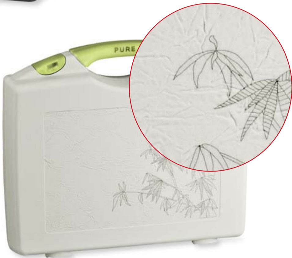
ErgoLine mit Textur „Japanpapier“ und Laserbeschriftung ErgoLine with texture "Japanese Paper" and laser writing

rose plastic has always set their focus on the customer. The highest goal for this ever-learning organisation is to continue to improve customer driven development. The overall positive evaluation proves that the packaging specialist has an outstanding image and is following the right philosophy.